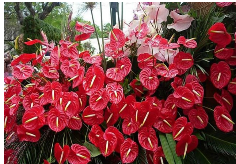
ANTÚRO. Anthurium Andraeanum Perene Luminosidade: meia sombra