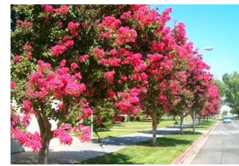
RESEDÁ – Lagerstroemia indica Perene Categoria: Árvores ornamentais Luminosidade: Sol Pleno Clima: Equatorial, Mediterrâneo, Oceânico, Subtropical, Tropical Porte: altura 3.6 a 6.0 metros