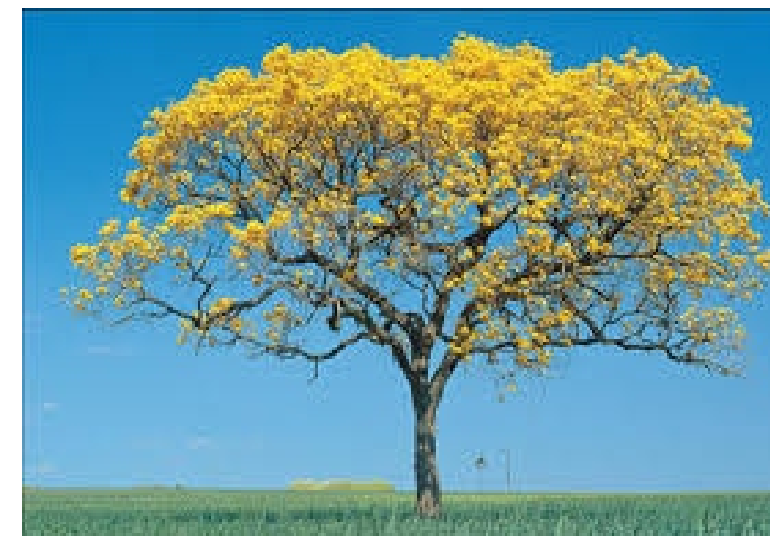
Ê AMARELO. Tabebuia chrysotricha Caduca Sol pleno Porte: 8 metros Clima: quente e úmido Copa: rala, diâmetro um pouco maior que a metade da altura..