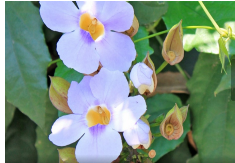
THUMBERGIA AZUL. Thunbergia grandiflora Perene Categoria: Trepadeiras Meia Sombra, Sol Pleno Porte: 4.7 a 6.0 metros