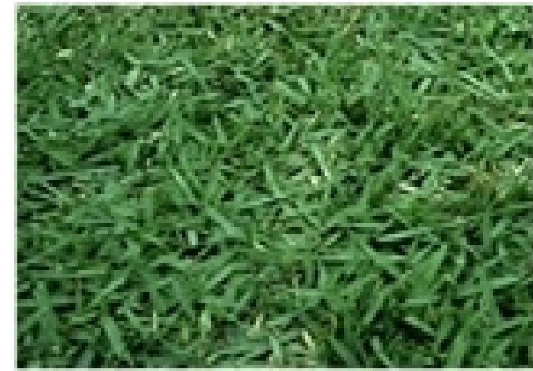
GRAMA ESMERALDA. Zoysia japonica Características: Possui folhas estreitas e médias, cor verde-esmeralda. Vantagens: forma um perfeito tapete de grama pelo entrelaçamento dos estolões com as folhas resistentes ao pisoteio.