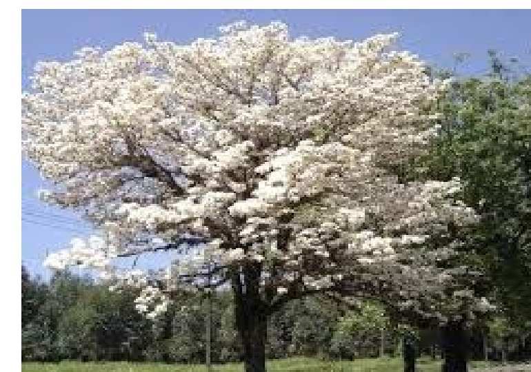
PÊ BRANCO. Tabebuia roseo-alba Caduca Sol: pleno. Porte: 16 metros. Clima: quente e úmido Copa: arredondada